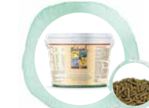
Junior on top

Junior on top ist mit hochverfügbaren Mineralstoffen, Spurenelementen, Vitaminen und essenziellen Aminosäuren speziell auf den entwicklungsbedingt steigenden Nährstoffbedarf von JUNGEN HERANWACHSENDEN PFERDEN abgestimmt. Junior on top gleicht fütterungsbedingte Nährstoffmängel aus und fördert eine vitale, gesunde Entwicklung von Fohlen und Jungpferden. Calcium, Phosphor und Vitamin D3 fördern die Ausbildung kräftiger Knochen und Gelenke. Die essenziellen Aminosäuren Lysin und Methionin unterstützen den Muskelaufbau. Die Spurenelemente Zink, Mangan, Kupfer, Selen und Jod unterstützen den noch jungen Organismus in der Zellbildung, dem Knochen- und Gelenkstoffwechsel, dem gesunden Hufwachstum, der Haut- und Fellbildung aber auch insbesondere in der Abwehr von Krankheiten und der Stärkung des Immunsystems.