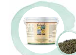
Heu on top

Viele Pferde werden stoffwechselbedingt oder saisonal OHNE WEIDEGANG gehalten. Bei ausschließlicher Heufütterung fehlen essenzielle Nährstoffe, die während des Trocknungsvorgangs verloren gehen. Heu on top gleicht diese NÄHRSTOFFVERLUSTE mittels der enthaltenen hochbioaktiven Vitalstoffe zuverlässig aus und wertet die Heurration ganzjährig oder über die Wintermonate auf. Heu on top ist ein innovatives Ergänzungsfuttermittel, das als Zusatz zum alltäglichen Mineralfutter gefüttert wird und die bisherige Basisversorgung auf den erhöhten Vital- und Nährstoffbedarf bei ausschließlicher Heufütterung anpasst.