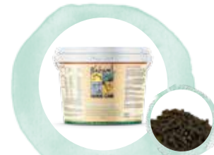
Senior on top

Mit zunehmendem Alter steigt auch der Bedarf an hochwertigen Vitalstoffen. Senior on top ist auf die Versorgung und den Bedarf von ÄLTEREN PFERDEN abgestimmt und fördert die Gesundheit und das Wohlbefinden bis in das hohe Alter. Vitamine, Mineralstoffe, Spurenelemente und essenzielle Aminosäuren sollten möglichst in natürlicher und hochverfügbarer Form bereitgestellt werden. Senior on top gleicht den Mehrbedarf gezielt mittels hochwertiger Nährstoffe aus und wirkt so ernährungsbedingten Störungen entgegen und fördert die Vitalität, Lebensfreude und Leistungsfähigkeit. Senior on top ist ein spezielles Ergänzungsfuttermittel, das als Zusatz zum alltäglichen Mineralfutter gefüttert wird, um die bisherige Basisversorgung optimal auf den altersbedingt erhöhten Vital- und Nährstoffbedarf anzupassen.