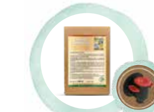
Omega Balance Öl

Die Kombination zweier hochwertiger Omega-3-Fettsäure-Lieferanten (Leinöl und Algenöl) und das stark Vitamin-E haltige Traubenkernöl geben der auf die Pferde ausgerichteten Mischung eine hohe Stabilität. Das Omega Balance Öl unterstützt mit seinen nativen Inhaltsstoffen den Stoffwechsel (Haut, Gelenke, Organe und Nerven) und kräftigt das Immunsystem. Besonders bedeutend in der Pferdefütterung sind die mehrfach ungesättigten Omega-3-Fettsäuren. Speziell die Fettsäurearten EPA und DHA, regeln wichtige STOFFWECHSELVORGÄNGE und spielen eine große Rolle bei der Vermeidung von ENTZÜNDUNGEN.